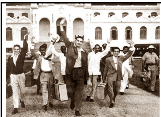
Salida de la prisión.

Al mediodía del domingo 15 de mayo de 1955, un oficial de la prisión avisa que los asaltantes comenzarán a salir en tres grupos con intervalos de más de 30 minutos. Fidel Castro Ruz, estuvo en el segundo. Descienden con sus maletas la escalinata hasta la explanada del penal, donde los esperan familiares, periodistas y fotógrafos que captan ese instante que ha perdurado como la imagen visual de la excarcelación.