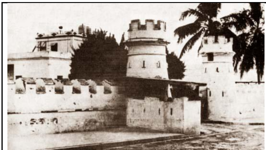
Cuartel Carlos Manuel de Céspedes en Bayamo