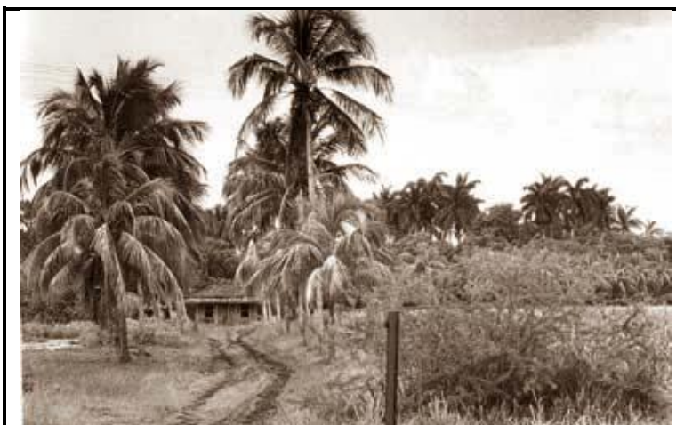
Finca Santa Elena