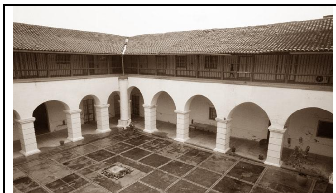
Cárcel el Vivac, fotografía página web.

Cuba (cárcel popularmente llamada Vivac , debido a que en este sitio las tropas vivaqueaban “descansaban” y le daban de comer a sus animales), para presentarlo ante los tribunales.