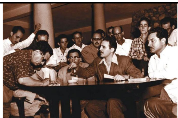
Entrevista a la salida de prisión.