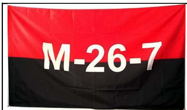
Bandera del M-26-7, fotografía página web.