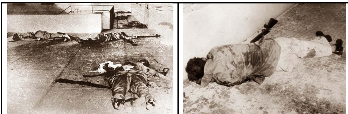
El régimen asesinó a 55 combatientes prisioneros.

Excepto unos pocos combatientes que pudieron escapar ayudados por el pueblo, casi todos los demás fueron capturados y gran parte de ellos asesinados en los días sucesivos. Sólo 6 combatientes del grupo que tenían la misión de atacar el Cuartel Moncada habían perecido en la lucha; pero las fuerzas represivas del régimen asesinaron a 55 combatientes prisioneros, sus cadáveres fueron colocados en diferentes partes del Cuartel, para luego presentarlos como caídos en combate.