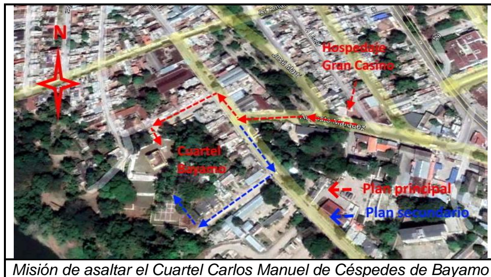
Misión de asaltar el Cuartel Carlos Manuel de Céspedes de Bayamo

Fracasado el factor sorpresa del que dependía el éxito de la acción, el débil armamento de los revolucionarios no podía enfrentar con efectividad el fuego de los militares, y los revolucionarios decidieron retirarse.