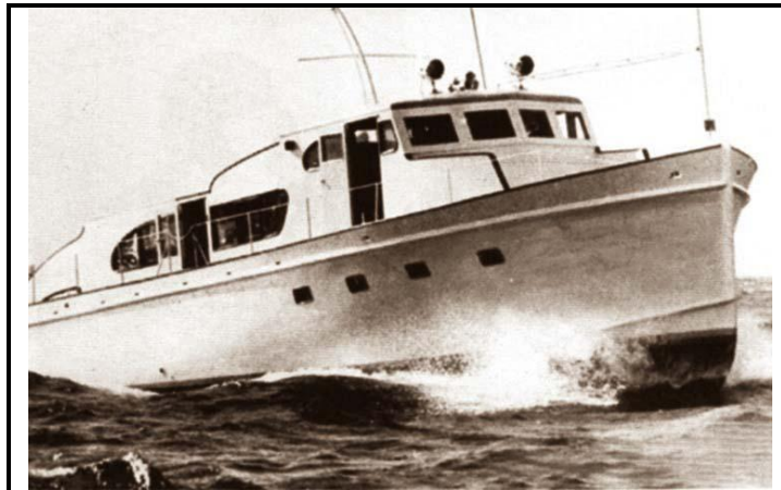
El Yate Granma, fotografía página web.

El 10 de octubre, compran el Yate Granma a la empresa Schuylkill Products Company Inc, inscrito en el puerto de Tuxpan, para realizar navegación de altura y emplearse como tráfico de recreo o viajes para pasar fines de semanas en el mar.