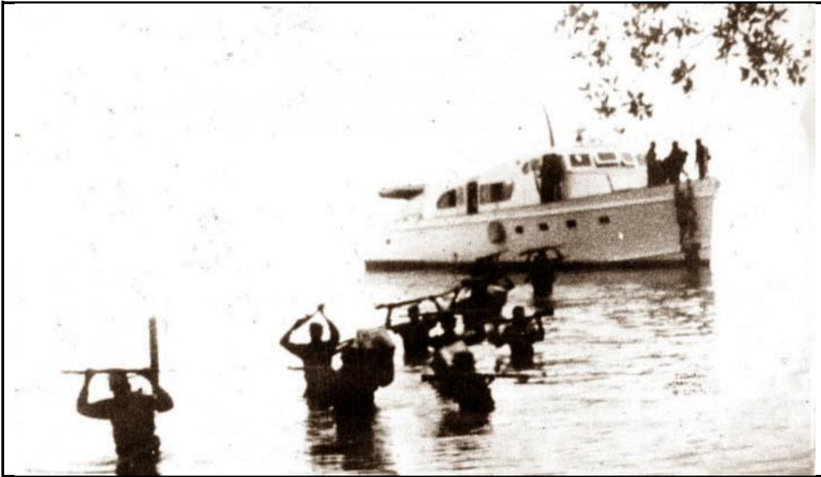
Desembarco de los expedicionarios del yate Granma, fotografía página web.

Los combatientes debieron atravesar los manglares hasta llegar a tierra firme, el cansancio, el extravío de algunos compañeros, el fuego de la aviación contra los manglares de Las Coloradas por donde transitaban, el 5 de diciembre de 1956, llegan a un monte, cercano a un cañaveral de la colonia nombrada Alegría de Pío, donde se produjo el sorpresivo encuentro con las fuerzas de la tiranía que sembró la confusión y la dispersión en los revolucionarios.