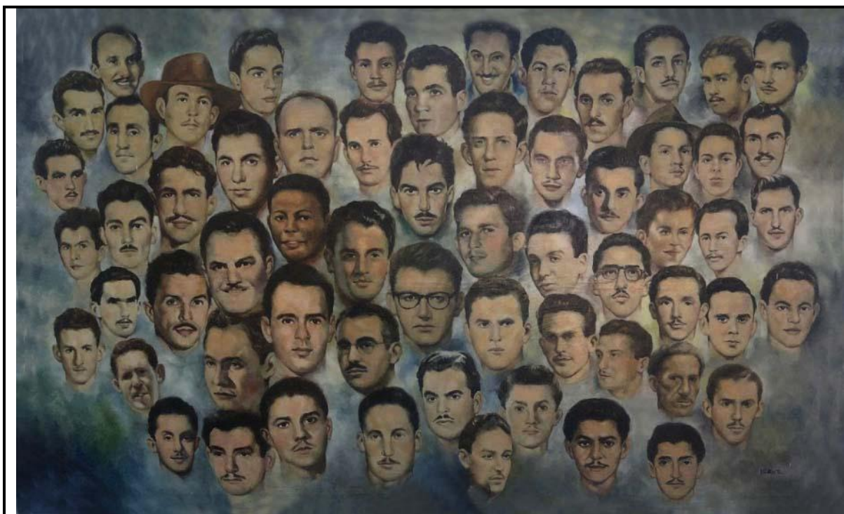
Mártires del Moncada