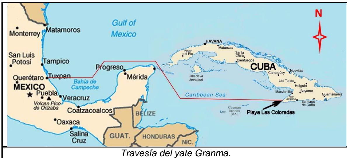
Travesía del yate Granma.

En una zona de mangles nombrada Los Cayuelos , a dos kilómetros de la playa Las Coloradas ( que es donde debieron haber desembarcado ), encalló el Granma, lo cual obligó a desembarcar. Eran las 06:50 horas del 2 de diciembre de 1956. Fidel Castro Ruz, cumplió con el contenido de su histórica frase: En el año 1956 seremos libres o seremos mártires.