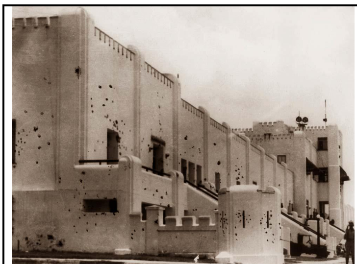
La lucha se entabló fuera del cuartel, fotografía página web.

En aquellas adversas e inesperadas circunstancias, los combatientes mostraban notable tenacidad y valentía. Se produjeron heroicas iniciativas individuales, pero ya no había forma de superar la situación creada. El enemigo disparando y una inevitable desorganización en las filas de los combatientes. Se ha perdido el contacto con los grupos N°1 y N°2. Los de Abel Santamaría Cuadrado y Raúl Castro Ruz respectivamente, con los cuales no tienen comunicación, solo se guiaban por el ruido de los disparos, ya decreciente por parte de los combatientes del grupo N°3. La sorpresa, factor decisivo del éxito, no se había logrado.